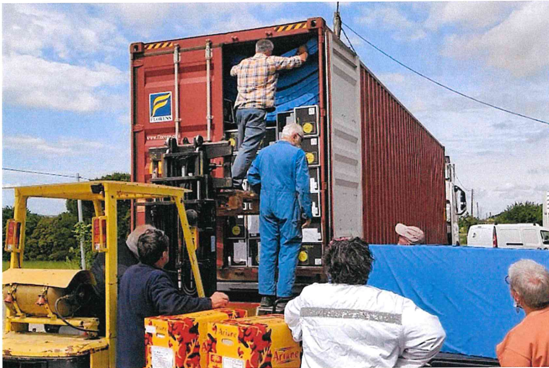
Départ d'un container